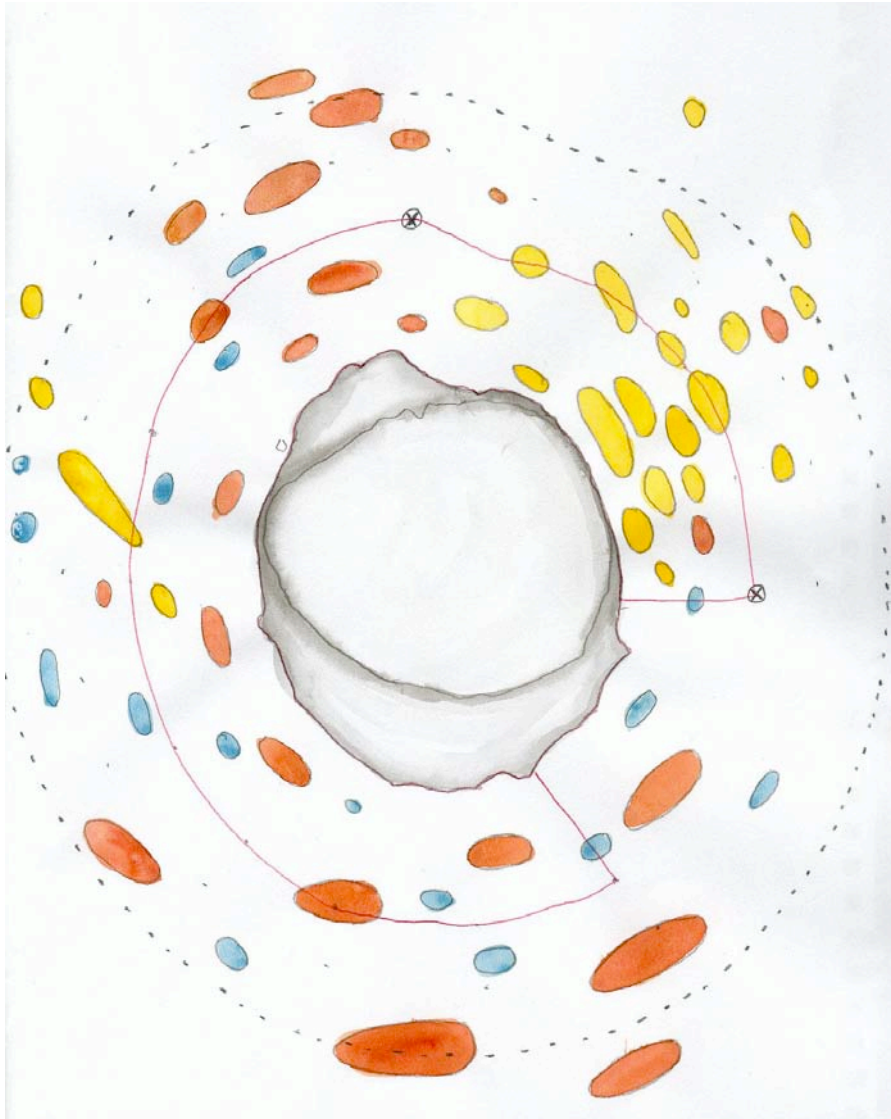
Fig. 2. Utdrag från Lilla Karlsö årsrapport år 2002.

Nedanstående kart är ett utdrag från årsrapporten för Lilla Karlsö år 2002 och visar fågelförekomsten runt Lilla Karlsö detta år. Motsvarande dokumentation finns för alla år från 1972 och framåt och för olika dagar respektive år.